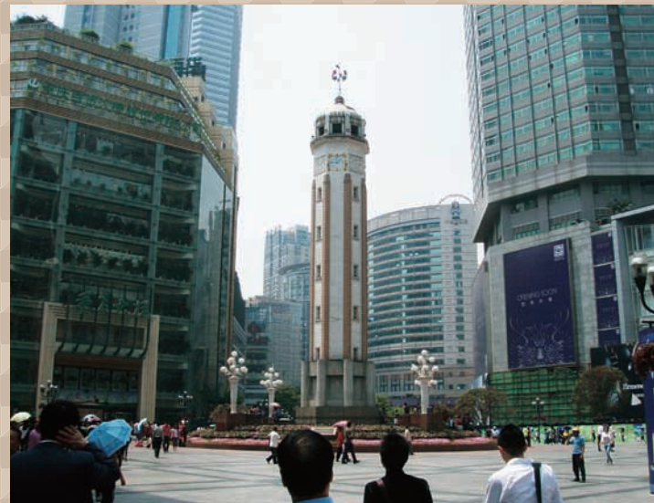
解放碑 抗日戦争勝利を記念する時計台。重慶市の中央ビジネスエリアに位置しており、周囲は高層ビルが立ち並んでいます。