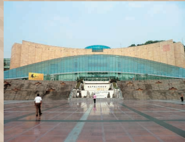
重慶中国三峡博物館 重慶や三峡地区の文化財を豊富に収蔵しており、その数は17万件にもものぼります。