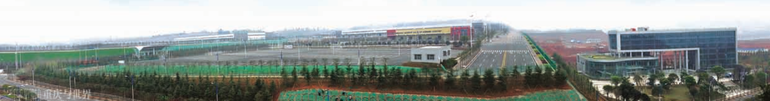
重慶江北国際空港 国内外の50以上の都市と70航路以上が就航しており、空路輸送においても中国西南地区の中心となっています。