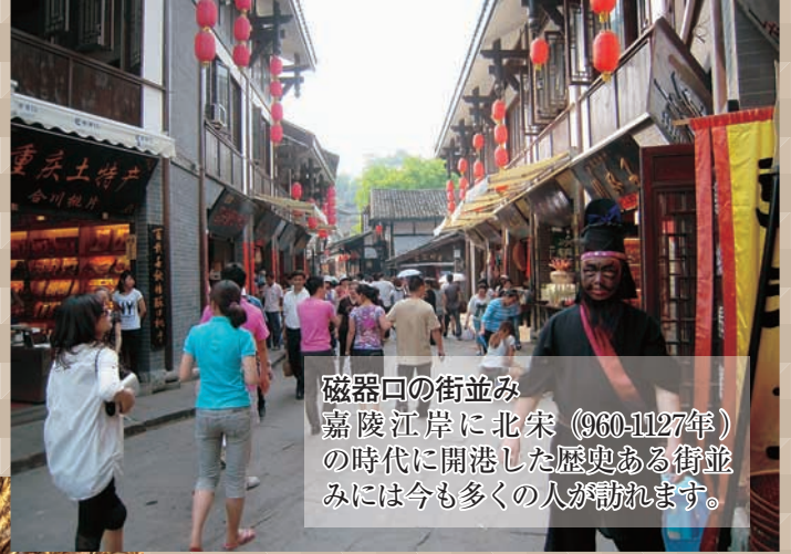
磁器口の街並み 嘉陵江岸に北宋（960-1127年）の時代に開港した歴史ある街並みには今も多くの人々が訪れます。