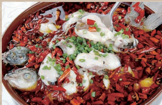
重慶料理 しびれる辛さが重慶料理の特徴で、特に重慶火鍋は季節を問わず多くの人に親しまれています。