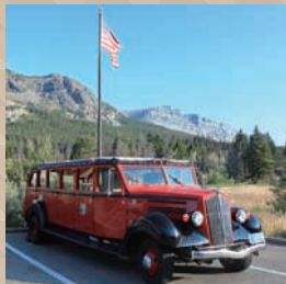
園内を走るレッド・バス