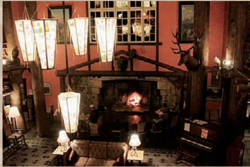
レイクマクドナルド・ロッジ 1913年に建てられたスイス風シャレー。 夜はランタンと暖炉の灯りで幻想的。