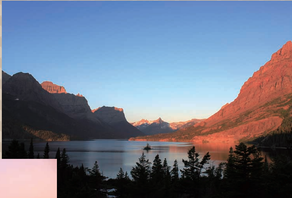
朝日を浴びるセントメリー・レイク エメラルド色の湖面と小島、周囲の峰々が絶景を作り出します。