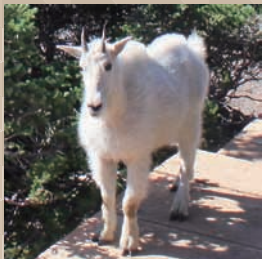
マウンテンゴート