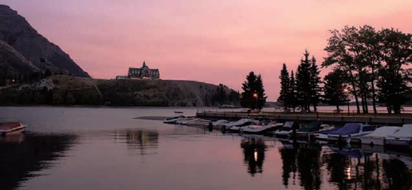
プリンス・オブ・ウェールズ・ホテル マジック・アワーがことのほか美しい、 ウォータートンの町のシンボル。