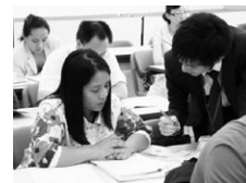
日本語研修の様子

TEL:03-5213-1726 E-mail:lgotp@clair.or.jp