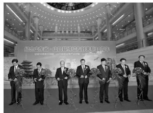
山東博物館での記念行事開幕式