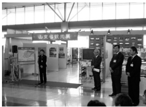
山口宇部空港での山東省観光展