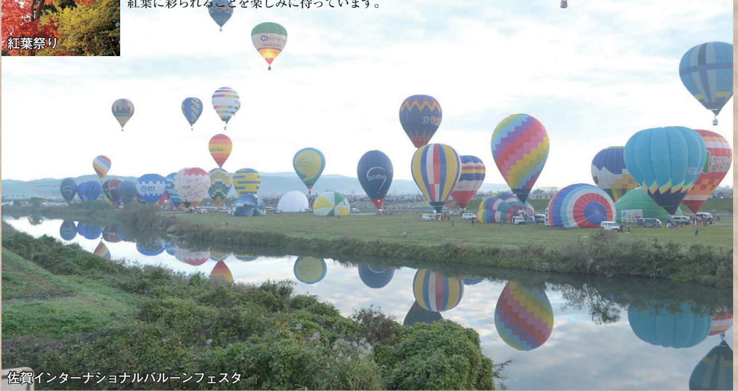
佐賀国際バルーンフェスタ

カリフォルニア州出身です。佐賀県唐津市で外国語指導助手（ALT）として勤務している3年目のJET参加者です。 佐賀県は、その穏やかな気候のため、JETに参加する前に住んでいた栃木県の秋よりも遅れて紅葉の時期を迎えます。空気がひんやりするとともに、唐津市が色とりどりの紅葉に彩られることを楽しみに待っています。