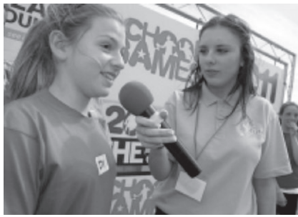
レポーターとして活躍

奨励されています。カリキュラム競技会は、「レポーター・ブログ・写真ジャーナリズムなど」、「作曲・合唱・