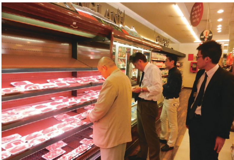
日本食材を扱うスーパーの視察（ベトナム・ホーチミン）

プロモーションアドバイザーの助言を踏まえ、ベトナム・ホーチミンで現地バイヤーなどとの商談会を実施しました。今後も官民一体となって鳥取県産牛肉の販路開拓を進めていく予定です。