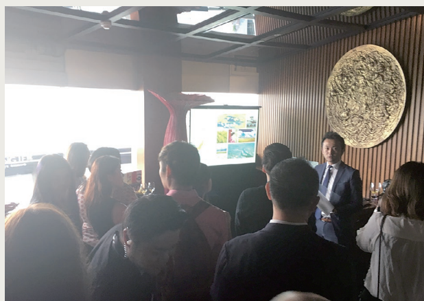
食と観光PRイベントでのプレゼン (シンガポール)