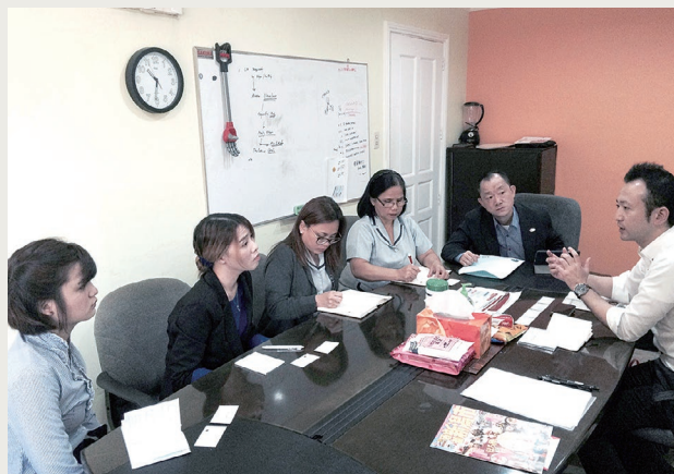
エージェントセールス (フィリピン)

帰国後は外国人観光客誘致の部署に配属され、シンガポールをメインとする東南アジアからの誘客セールス・プロモーションを担当するという、まさにクリアで得られた知見や現地で培ったネットワークをダイレクトに生かす絶好の機会をいただきました。試行錯誤しながらもシンガポールからの来訪者を右肩上がりで増やすことが