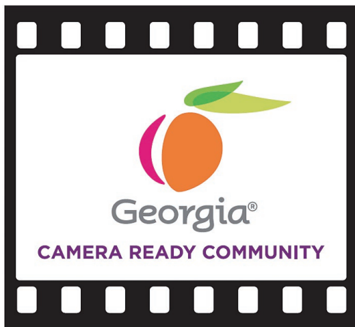
カメラ・レディ・コミュニティ・プログラムのロゴ

これは、州内の地方別に連絡係を配置し、地域に根差したサポートを行うものです。具体的には、ロケ地の下見の同行、撮影許可手続きに関する情報提供、地元で手配可能なレンタル業者やケータリングの紹介等の支援が行われます。連絡係の業務自体は日本のフィルム・コミッションと同様ですが、特筆すべきは州を159に分けた全てのカウンティでこの連絡係を配置したことでしょう。各カウンティの観光経済部局等のフルタイム職員が任命されており、地域別の問い合わせ先が明確となっています。また、州は連絡係向けのガイドブックや映画業界用語の資料、撮影同意書や撮影周知書類のサンプル等を共有しており、経験が浅い連絡係や人事異動で新たに担当となった者をサポートする体制を整えています。このプログラムにより、州と地方政府が連携した、きめ細やかな制作支援が可能となりました。