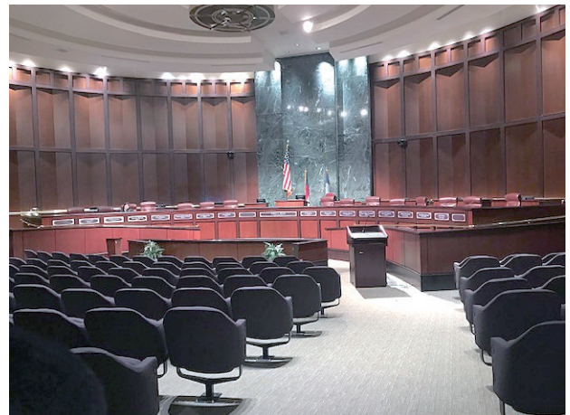
ジョージア州の州都、アトランタ市の市議会会議場。映画「ブラックパンサー」では国連の会議室として撮影に使われた

映画のエンドクレジットで桃のロゴマークが流れてきたら、それはジョージア産の映画です。今後もジョージア州がこのまま成長を続けるのか、他の州が巻き返しを図るのか、引き続き注目していきたいと思います。