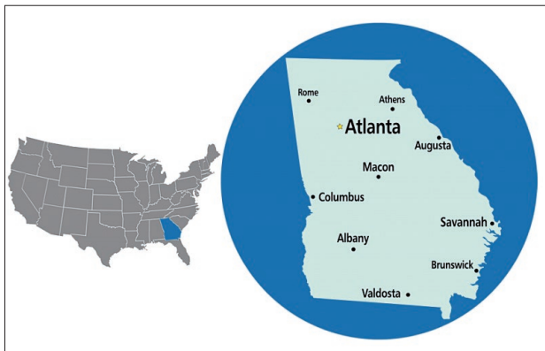
ジョージア州の位置と地図

この、「世界で一番売れた映画」が制作されたのが、アメリカ南東部に位置するジョージア州です。同作品は、ハリウッドを有するカリフォルニア州やニューヨーク州等でも撮影されていますが、制作の主要拠点となったのはジョージア州でした。今や「Hollywood of the South (南部のハリウッド)」とも呼ばれるジョージア州の映画産業は近年急成長を遂げており、映画業界が決して無視できない一大映画制作地となっています。