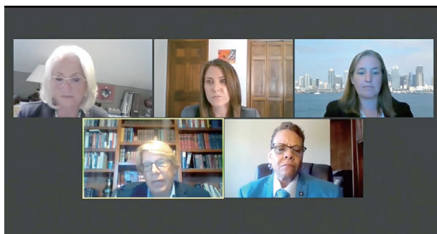
登壇者も聴衆も自宅やオフィスから参加。盛んな議論が交わされた

総会では、各州のコロナウイルスによる経済的打撃に対する支援策、ジョージ・フロイド事件に端を発する警