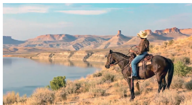
ランチタイムに流れたワイオミング州の美しい映像

同種の総会の多くが中止を決める中、アメリカ西部の開拓者精神で果敢にバーチャル開催に踏み切ったCSG西部支部総会。来年はコロラドスプリングスで開催される予定です。