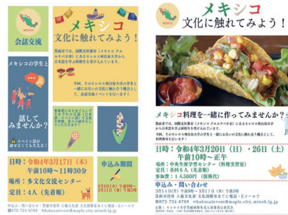
オンライン開催「会話交流と料理教室」

そのような中でも対面での交流にかえて、継続して交流する場を持てるようにオンラインで会話交流と料理教室の交流イベント