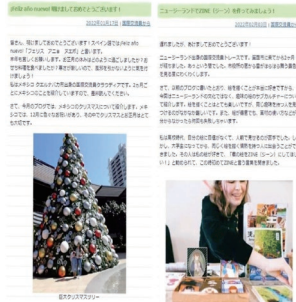
「撮れたて箕面ブログ」に掲載されたCIRの記事

ています。ブログの内容は、文化や料理、芸術などさまざまです。興味のある方は是非「撮れたて箕面ブログ」と検索し読んでみてください。