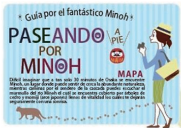
箕面てくてく散歩マップ

2019年以前、箕面市の観光マップは日本語版と英語版、中国語版、韓国・朝鮮語版しかありませんでした。