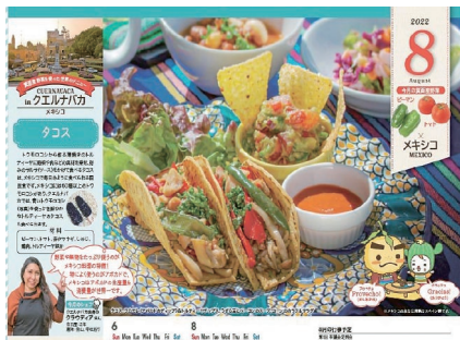
箕面市の2022年のカレンダー

の社会参加を促進するとともに、気軽に交流する場として、これまで80人を超える方がシェフとして活躍しています。クラウド