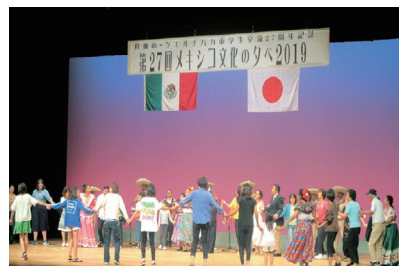
メキシコ文化のタベ

ただ、残念ながら2020年以降は新型コロナウイルス感染症の影響で新たな研修生の受け入れができていません。