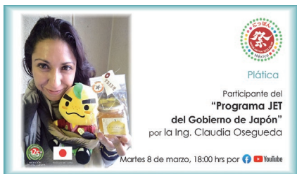
オンライン「にっぽんまつり」(2022年)

このにっぽんまつりでは、日本・メキシコの長い友好関係について、オンラインでコンサー