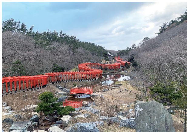
つがる市が誇る高山稲荷神社の千本鳥居

着任前の CIR の多くは、「国際交流員」とは立派な庁舎内で毎日スーツを着て外国から来日した外交官の通訳や、重要な政府文書の翻訳をしている人をイメージしますが、実際の仕事は全く違います。東京都内や県庁で働いている CIR の業務はそのイメージに近いかもしれませんが、私のように市町村に所属している CIR はより市民に寄り添った仕事に取り組んでいます。