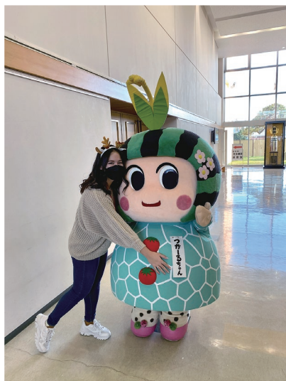
国際交流フェアでつがる市マスコット「つがるちゃん」と一緒に！