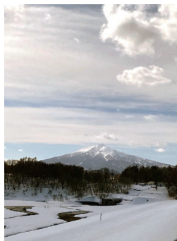
「津軽富士」と呼ばれている青森県の最高峰、岩木山 (高さ 1,625 m)

CIR の役割が今の自分に一番適していると思い、JET プログラムに応募して合格しました。配属先はもちろん親戚がいる広島県を希望しましたが、青森県の西北部にあるつがる市になりました。意外な行き先だとは思いましたが、「大雪とりんごが有名な青森で頑張ろう！」と決心しました。