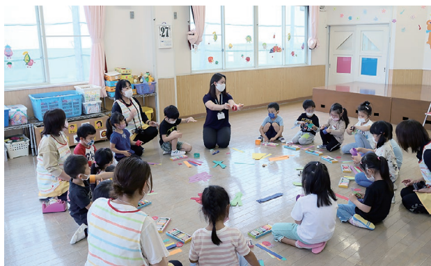
ふれあい事業で保育園児たちと一緒に工作

姉妹都市交流の他、つがる市 CIR の主な業務は市民と関わる仕事です。ふれあい事業では市内の保育園を訪れ、園児たちと絵本の読み聞かせ、ゲーム、工作などを楽しみながら英語や異文化に触れる機会を作ります。