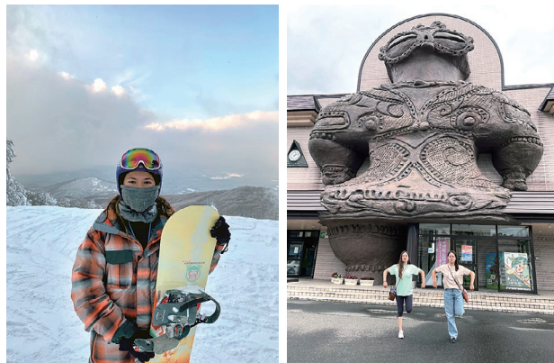
左：鱒ヶ沢町のスキー場でスノーボード 右：縄文時代の遮光器土偶の形をしたつがる市 JR 木造駅で「しゃこちゃん」ポーズ！

日楽しく過ごしています。冬は寒くて雪が多く降り、人生で一番辛い冬もここで過ごしていますが、スノーボードという新たな趣味を発見しました。