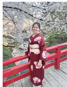
弘前公園でお花見

最初は聞き取れない津軽弁の方言に囲まれて困っていましたが、1年が経つ頃には私の日本語もすっかり津軽弁の訛りに変わってしまいました。今までの経験を振り返ると、見知らぬ土地だったつがる市にここまで馴染むことができるとは思いませんでした。シャイで心配性だった私が、慣れ親しんだアメリカの環境から踏み出して、青森での新たな経験と向き合って頑張ってきたことを今は誇りに思っています。これからも怖がらずに色々なことに挑戦したいと思います！