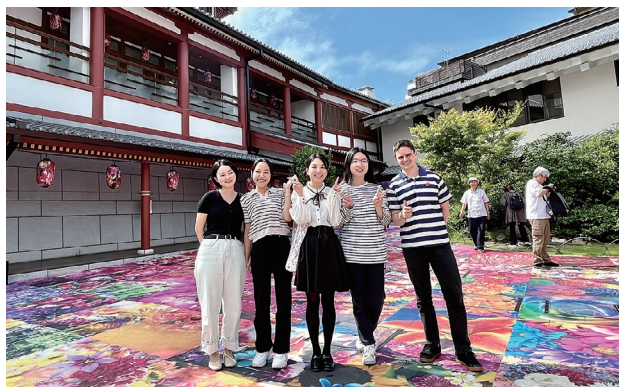
県内の CIR で集まり、遊びに行きました (松山市道後温泉)

愛媛県の JET プログラム参加者は、多くを外国語指導助手 (ALT) が占めていますが、国際交流員 (CIR) を県内に 7 人配置しているほか、2023 年の夏までスポーツ国際交流員 (SEA) を招致していました。現在、150 人を超える参加者が県内各地に配置されており、彼らが孤立しないよう、取りまとめ団体アドバイザー (PA) や、地域アドバイザー (RA)、えひめ AJET (JET プログラム参加者の会) がイベントの企画や生活などの情報提供を行い、参加者同士のつながりを作ろうと奮闘しています。