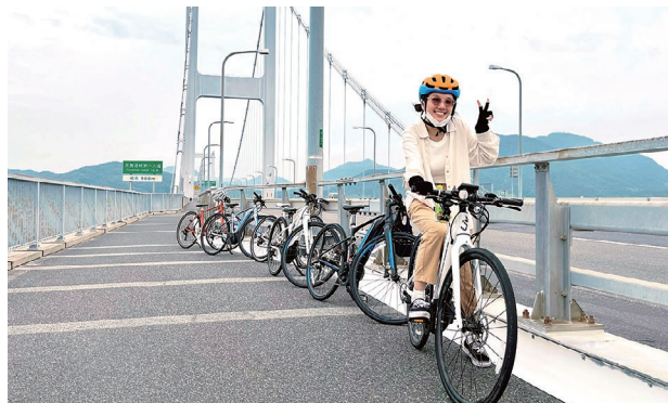
サイクリングを通じた交流事業に参加する何さん（今治市しまなみ海道）

愛媛の自然に恵まれたところを特に楽しんでおり、愛媛が大好きになりました、とのこと。これからもたくさん勉強して、「愛媛マスター」になってくれることを期待しています。