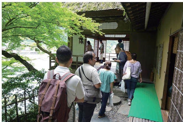
地域交流イベントの様子（大洲市臥龍山荘）

また、ミヤさんはJETPAとして県内JETプログラム参加者からの相談などにも対応しています。参加者の情報を共有してくれることから、JET担当者PAである筆者を助けてくれています。今後も地域交流に関するイベントを企画してくれることを楽しみにしています。