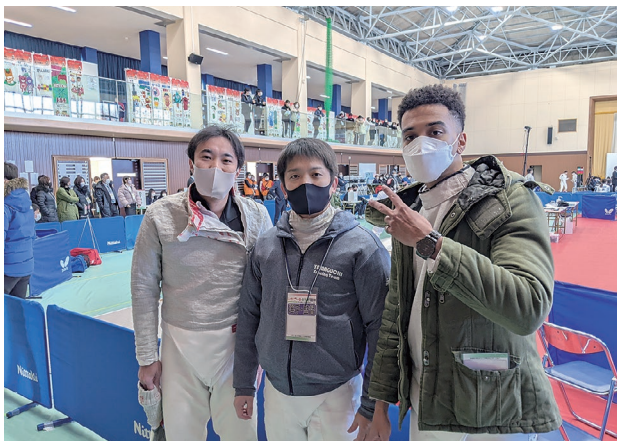
フェンシングの全国大会にて

スポーツは、言語を超えた世界共通語であると私は考えています。そういった意味では、地域コミュニティと関わる上で最も手取り早い方法の 1 つです。