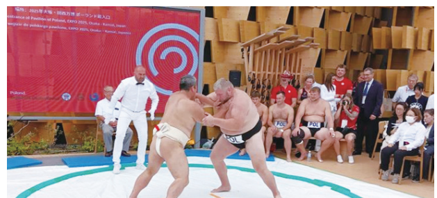
大阪万博での相撲の取組