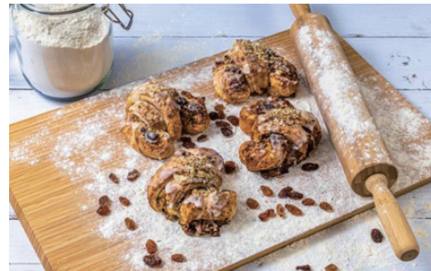
聖マルチンのクロワッサン