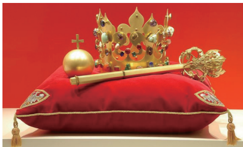
ポーランド王国の歴史を象徴する王冠