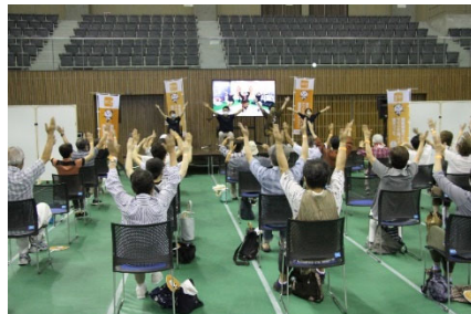
项目体验会的情景