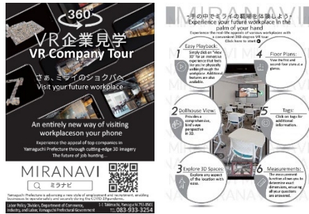
Site de visites virtuelles d'entreprise « MIRANAUI »