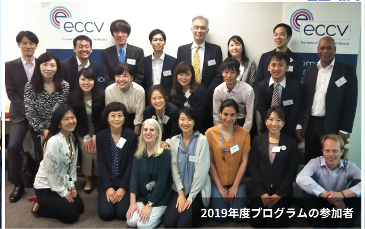
2019年度プログラムの参加者

毎年、クレア多文化共生課とシドニー事務所ではオーストラリアにおける多文化共生施策を学ぶ交流プログラムを実施しており、参加者からは大変好評のお声をいただいております。みなさんもぜひ参加してオーストラリアにおける多文化共生政策を学びませんか。詳しくは自治体国際化協会多文化共生課（03-5213-1725）