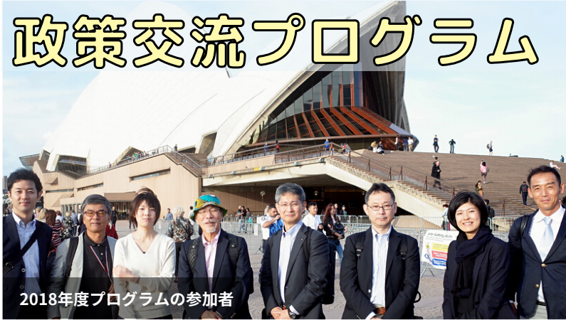
2018年度プログラムの参加者