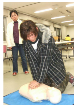
④心臓マッサージをする